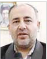
محمد رضا منصور عضو کمیسیون صنایع و معادن مجلس شورای اسلامی

پیش‌بینی اجرای اصل ۴۴ قانون اساسی و خصوصی‌سازی در صنعت خودرو که در برنامه ششم توسعه به صورت جدی به آن پرداخته شده، امید این صنعت را به آینده‌ای روشن افزایش داده است. هرچند در سال‌های گذشته توسعه خصوصی‌سازی در صنعت خودرو بارها مورد تأکید قرار گرفته اما به نظر می‌رسد تصمیم‌گیری‌ها به‌ویژه پس